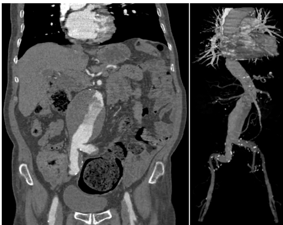
شکل (۲): تصاویر پزشکی از آنوریسم آنورت شکمی. (الف) اسکن CT شکم در نمای کروئال، (ب) آنژیوگرافی CT در دید سه‌بعدی.