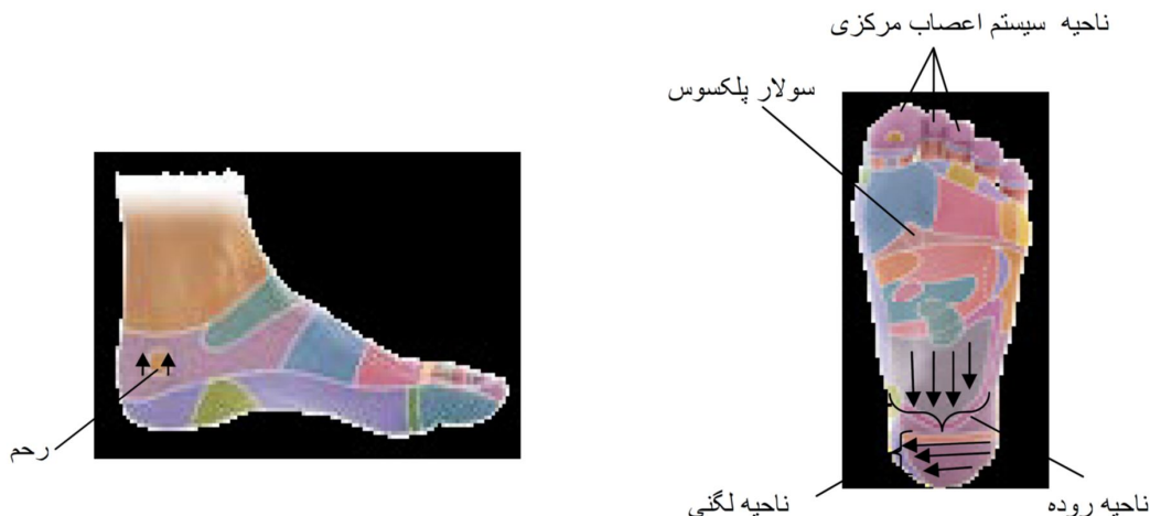
شکل (۲): مناطق انجام رفلکسولوژی پا

فرم کوتاه شده پرسشنامه درد مک گیل شامل ۱۲ کلمه به‌منظور بررسی کیفیت درد در دو بعد حسی (۹ کلمه: بررسی کیفیت درد از نظر تیر کشنده بودن، تیز بودن مانند فروکردن چاقو، کرامپی بودن، حالت داغ شدن، درد معمولی، احساس سنگینی داشتن، حساس بودن ناحیه جراحی و گزشی بودن درد) و بعد عاطفی (۳ کلمه: احساس خستگی مفرط داشتن، احساس ناخوشی و احساس ترس) درد است. و به این صورت که جهت بررسی کیفیت درد، پاسخ هر کلمه به‌صورت اصلاً، خفیف، متوسط و شدید طبقه‌بندی شده است که به پاسخ شدید نمره ۳، پاسخ متوسط نمره ۲، پاسخ خفیف نمره ۱ و پاسخ اصلاً نمره صفر تعلق می‌گیرد؛ و درنهایت میانگین نمره درد گزارش می‌شود. نمره کل این پرسشنامه به این صورت است که نمره صفر نشان‌دهنده حداقل نمره کل و نمره ۳۶ نشان‌دهنده بیشترین نمره است. بنابراین از این ابزار سه نمره شامل نمره بعد حسی، عاطفی و نمره کل به دست می‌آید. به‌علاوه این پرسشنامه دارای یک مقیاس کلامی (جهت سنجش شدت درد) نیز است. این مقیاس شامل ۶ گویه (از بدون درد تا شکنجه آور) با نمرات ۰ تا ۵ است. به این صورت که توصیف بدون درد با نمره صفر، درد خفیف ۱، ناراحت‌کننده ۲، زجرآور ۳،