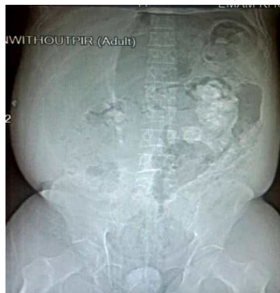
شکل (۱): در کلیه چپ ناحیه مهره‌های L3 و L4، توده اپک شاخ‌گوزنی شکل قابل‌رؤیت است.

اسکواموس سل کارسینوماهای کلیه جزء نادرترین تومورهای بدخیم سیستم ادراری است با فراوانی کم‌تر از ۱ درصد که در بیشتر موارد در مثانه و پیشاب‌راه مردان با میانگین سنی ۵۴ بروز می‌یابد (۶). در این گزارش، بیمار ما خانم ۵۶ ساله بود. علائم کلینیکی در این بیماران اختصاصی نیست و بیماران معمولاً با درد ناحیه شکم و پهلو، تهوع و استفراغ مراجعه می‌کنند و در اکثر موارد بیماران سابقه‌ای از سنگ کلیه دارند (۷). به دلیل اختصاصی نبودن علائم کلینیکی در اکثر موارد تشخیص کارسینوم سلول سنگفرشی با تأخیر صورت می‌گیرد و به علت ماهیت تهاجمی این تومور، متاستاز به لنف‌نودها و بافت‌های اطراف کلیه رخ می‌دهد، به همین علت پروگنوز این بیماری ضعیف است و در صورتی‌که متاستاز اسکواموس سل کارسینوما تأیید شود بیماران در عرض چند ماه (معمولاً ۵ ماه) جان خود را از دست می‌دهند (۵ و ۸). بیمار ما نیز سابقه سنگ کلیه داشت و با علائم کلینیکی مشابه مراجعه کرده بود. تصاویر رادیوگرافی از این بیماران مانند علائم کلینیکی، اختصاصی نیست و معمولاً حضور سنگ‌های کلیوی و هیدرونفروزیس را بیان می‌کند بر این اساس، تشخیص قطعی و نهایی ضایعه فقط با بررسی‌های نمای میکروسکوپی بافت کلیه امکان‌پذیر است (۹). ماهیت این تومور نامشخص است ولی فاکتورهایی نظیر تغییرات ژنتیکی، مصرف فناسستین، کمبود ویتامین A، استعمال سیگار و دخانیات (۶۰ درصد موارد)، پیلونفریت، تحریکات مزمن، عفونت‌هایی که باعث متابلازی