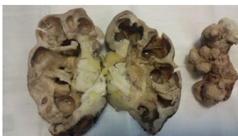
شکل (۲): نمونه بیوپسی شده از کلیه بیمار که در هنگام برش سنگ کلیه با نمای شاخ گوزن آشکار شد و علاوه بر آن توده‌ای تومور گسترش یافته در ناحیه پلوئیس کلیه نیز دیده می‌شود.