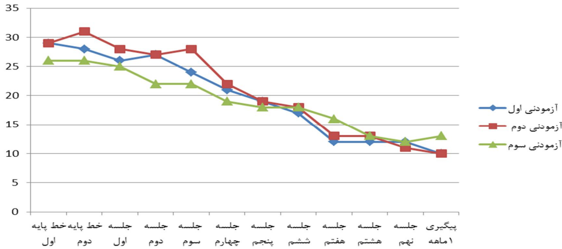
نمودار (۲): سیر نزولی نمرات آزمودنی‌های پژوهش در خرده مقیاس تجربه مجدد مقیاس IES-R در طول جلسات درمانی

نمودار ۱ نشان می‌دهد که هر سه آزمودنی سیر کاهشی در نمرات خرده مقیاس برانگیختگی مقیاس تجدیدنظر شده تأثیر رویداد (IES-R) داشته‌اند.