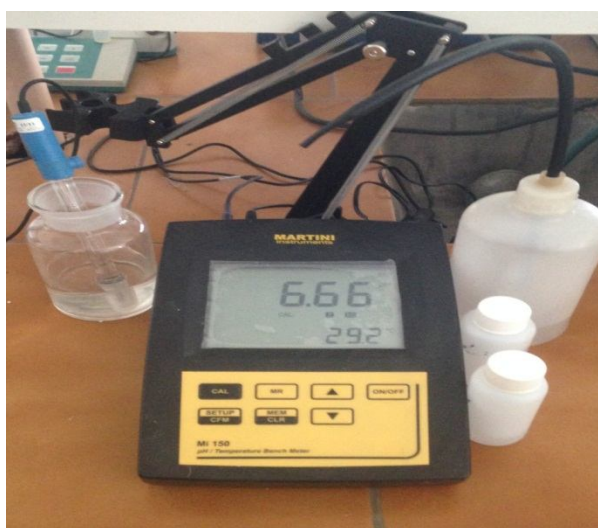
شکل (۲): دستگاه pH سنج

این مطالعه به‌صورت یک کارآزمایی بالینی متقاطع تصادفی شده انجام شد. جامعه آماری موردبررسی دانشجویان دندان‌پزشکی دانشگاه علوم پزشکی رفسنجان بودند که با اخذ رضایت‌نامه کتبی از افراد واجد شرایط، وارد مطالعه شدند. معیارهای ورود افراد به این مطالعه شامل: محدوده سنی ۲۰ تا ۳۰ سال، داشتن انگیزه و تمایل کافی برای شرکت در مطالعه و معیارهای خروج افراد شامل: وجود اپلاینس‌های ارتودنسی، استفاده از پروتز پارسیل، داشتن جرم زیاد و بریج‌های وسیع، باردار بودن فرد، مصرف دخانیات، ابتلا به پریدونتیت، ابتلا به آن دسته از بیماری‌های سیستمیک نظیر: دیابت، آسم، نارسایی کلیوی، نارسایی کبدی، صرع، اختلال خونی و اختلال غدد که بر وضعیت ترشح بزاق دهان و دندان تأثیرگذارند و درنهایت عدم همکاری فرد برای ادامه مطالعه بود.