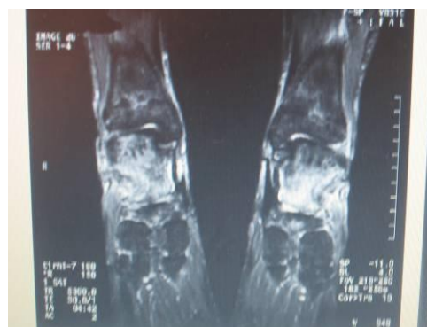
شکل (۲): ۱ دم حاد استخوان ۳ ماه بعد از پیوند

یک مورد با سندرم درد حاد استخوانی مشخص شد این مورد خانم ۴۴ ساله ای بود که ۱۲ هفته قبل تحت عمل پیوند کلیه قرار گرفته بود. شکایت اصلی درد عمیقی در هر دو ساق پا بود. سابقه ای از تروما، نفرس و آرتریت وجود نداشت و در معاینه مایع، اریتم یا تورم وجود نداشت هر دو مچ پا شدیداً حساسیت موضعی داشتند. دامنه حرکتی زانو و مچ پا کامل بود و درد با سر پا ایستادن تشدید می‌شد (شکل ۲).