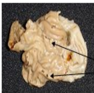
زخم‌های بزرگ، متوسط و کوچک در سراسر بافت معده