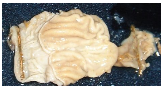
شکل (1): عدم وجود زخم در گروه کنترل معده کاملاً سالم و فاقد هرگونه زخم می‌باشد.