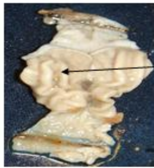
آثاری از خونریزی پتشی در معده

شکل (3): کاهش زخم‌ها با تجویز ویتامین E خوراکی قبل از تجویز آسپیرین تزریقی در موش رت