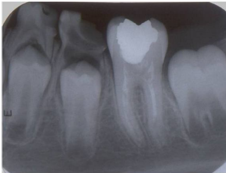
شکل (۳): تصویر پری آپیکال دندان یکسال پس از درمان که نشان دهنده تکامل ریشه می‌باشد.

مطالعات متعددی در زمینه مهندسی بافت جهت بازسازی ارگان فانکشنال عاج-پالپ در آپکس ریشه به منظور تکامل ریشه انجام شده است. تمامی این مطالعات بر اساس نقش سلول‌های بنیادی در رژنراسیون دندان می‌باشند (۱۲). در طی دهه اخیر، سلول‌های بنیادی از بسیاری از بافت‌ها جدا شده‌اند و جهت اهداف مهندسی بافت و کاربردهای کلینیکی مربوطه مورد مطالعه قرار گرفته‌اند. سلول‌های بنیادی پالپ دندان (DPSCs) از پالپ دندان بزرگسال جدا شده‌اند و پتانسیل بالایی برای خود-نوزایی و نیز تمایز به کندروبلاست ها، استئوبلاست ها، نرون ها و سلول‌های چربی و سلول‌های شبه ادنتوبلاست دارند (۱۳، ۱۴). همچنین به علت بیان برخی آنتی ژن‌های ویژه سطحی سلولی مانند CD-44, CD90,