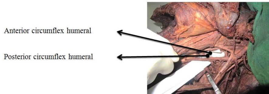
شکل شماره (۴): منشعب شدن شریان‌های سیر کومفلکس هومرال خلفی و سیرکومفلکس هومرال قدامی از شریان ساب اسکاپولار

واریاسیون دیگری که در این جسد مشاهده شد منشأ شریان‌های سیرکومفلکس هومرال قدامی و خلفی بود، این شریان‌ها در حالت عادی از بخش سوم شریان آگزیلاری جدا می‌شوند ولی در موردی که ما تشریح کردیم این شریان‌ها هر دو از شریان ساب اسکاپولار جدا شده بودند. (شکل ۴) از نظر ضخامت