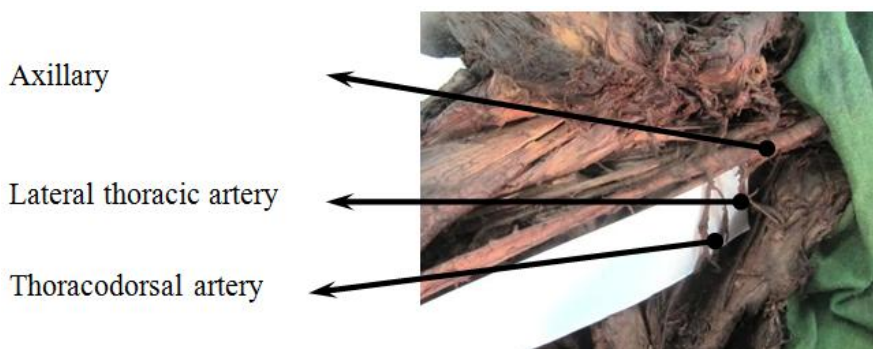
شکل شماره (۲): تنه‌ی مشترک شریان‌های توراسیک خارجی و توراکو دورسال

شریان ساب اسکاپولار پس از جدا شدن سیر کومفلکس اسکاپولار است، با شریان توراسیک خارجی تنه‌ی مشترکی دارد (شکل ۲)، شریان توراسیک خارجی در جدار خارجی توراکس به همراه عصب لانگ توراسیک طی مسیر کرده و به جدار توراکس خون‌رسانی می‌کند.