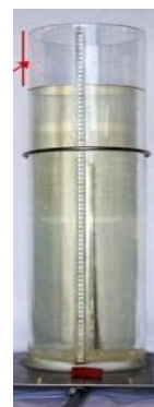
شکل شماره (۱): حجم سنج

طی انجام یک مطالعه تجربی از نوع مطالعه موردی، در مرحله اول تحقیق، ۱۰ نفر از بیماران مبتلا به ادم لنفی به دنبال ماستکتومی ناشی از سرطان پستان که توسط پزشک متخصص به درمانگاه فیزیوتراپی دانشکده توان‌بخشی تبریز ارجاع شده بودند، پس از تکمیل رضایت‌نامه و پرسش‌نامه و ارزیابی‌های اولیه در دو گروه ۵ نفره به صورت تصادفی در طی ۱۵ جلسه تحت درمان قرار گرفتند. میزان ادم با استفاده از اندازه‌گیری حجمی مایع جابجا شده پس از غوطه‌وری اندام داخل حجم سنج ۴ بدست آمد (شکل (۱)).