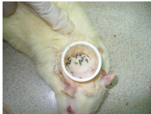
شکل شماره (۲): نوزاد کنه اورنیتودوروس لاهورنسیس در حال خون‌خواری

نحوه انجام ثبت با استفاده از دستگاه فیزیوگراف: