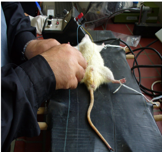
شکل شماره (۳): نحوه قرار دادن الکترودهای سوزنی در بطن عضله گاسترونیموس

در این حالت الکترودهای تحریکی در نزدیکی انتهای دور (Distal End) عضله قرار داده شده و الکترودهای در بطن عضله مستقر می‌گردیدند. در مرحله بعدی لازم بود توانایی عصب در ایجاد انقباض عضله بررسی شود. برای ثبت EMG از طریق تحریک عصب و تایید عدم قطع ارتباط عصب و عضله، الکترودهای ثبت در بطن عضله و الکترودهای تحریکی در روی عصب سیاتیک قرار می‌گرفت. برخورد الکترودهای سوزنی تحریکی با تنه عصبی موجب یک انقباض ضعیف در عضله می‌گردد که نشان دهنده امکان تحریک عصب می‌باشد (شکل شماره ۳). وجود تفاوت معنی‌دار در میزان الکترومیوگرام عضله در دو حالت می‌تواند بیانگر اختلال عصب و عضله بوده و عدم تفاوت نشان دهنده برقراری مناسب ارتباط عضله و عصب خواهد بود.