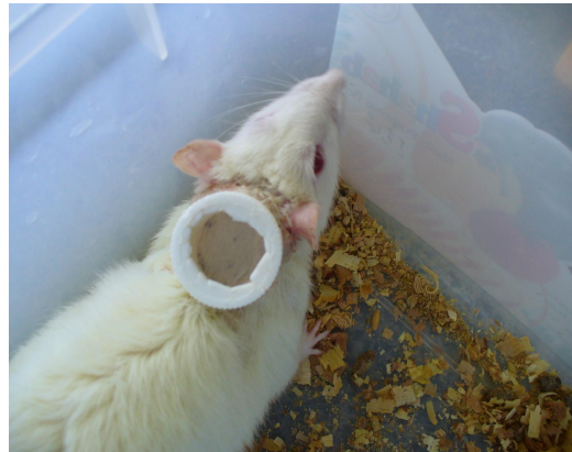
شکل شماره (۱): نحوه اتصال کنه‌ها بر روی شانه رت

راحتی با چرخاندن آن باز و بسته می‌شد (شکل شماره ۱) و هر روز کنه‌های قبلی با کنه‌های جدید تعویض می‌شد (۱۵) این کار به مدت ۱۵ روز انجام شد. آلوده نمودن رت‌ها با کنه‌های نوزاد نیز در دو گروه رت انجام پذیرفت و برای آلوده نمودن رت‌ها بیش از ۵۰ نوزاد اورنیتودوروس لاهورنسیس بر روی آن‌ها قرار داده شد (شکل شماره ۲). رت‌های تحت مطالعه روزانه از نظر ظهور آثار فلجی معاینه می‌شدند.