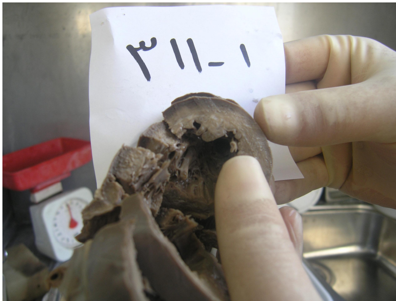
شکل شماره (۱): کانون‌های تغییر رنگ کرمی پراکنده (مشابه رگه‌های فیبروز) در جدار بطن چپ که در بررسی ماکروسکوپی قابل مشاهده می‌باشد.

مورد معرفی شده شیرخوار (دختر) سه ماهه‌ای بود که با تابلوی مرگ ناگهانی با علت ناشناخته و جهت تعیین علت فوت به پزشکی قانونی تبریز ارجاع شده بود. در کالبدگشایی یافته ظاهری و یا بیماری غیر قلبی که توجیه کننده علت فوت باشد یافت نشد. در بررسی به عمل آمده قلب بزرگ‌تر از حد طبیعی بوده (به وزن ۱۲۰ گرم) و در سطح قلب پتشی‌های پراکنده مشاهده شد، مجرای شریانی بسته بوده و در برش‌های کلاسیک انجام شده، حفرات بطنی بخصوص بطن چپ گشاده‌تر از حالت طبیعی و