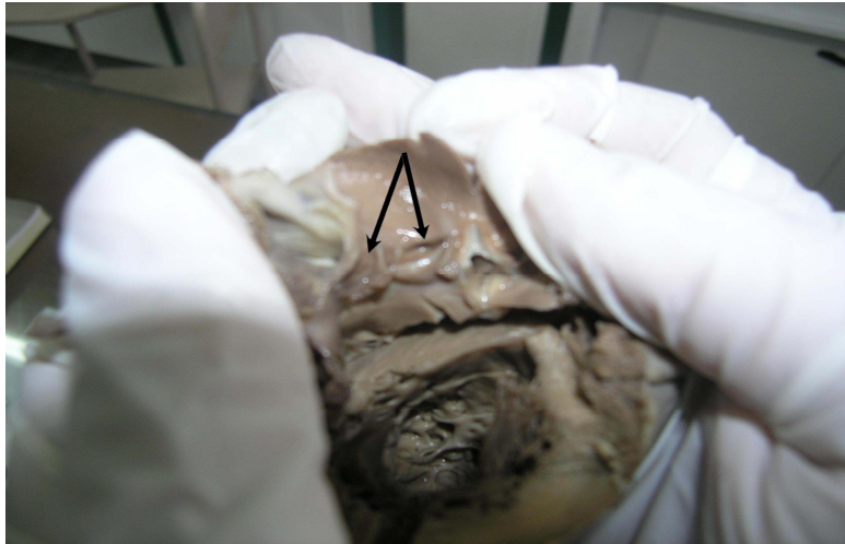
شکل شماره (۲): در بررسی ابتدای آنورت مدخل شریان کرونری راست در محل طبیعی خود بود ولی منشأ شریان کرونری چپ در محل طبیعی خود مشاهده نشد.