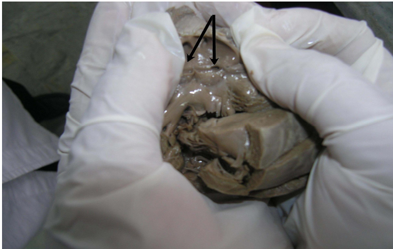
شکل شماره (۳): پس از برش‌های تکمیلی مدخل یک شریان کوچک در محل سینوس چپ در بچه شریان ریوی مشاهده می‌شود.