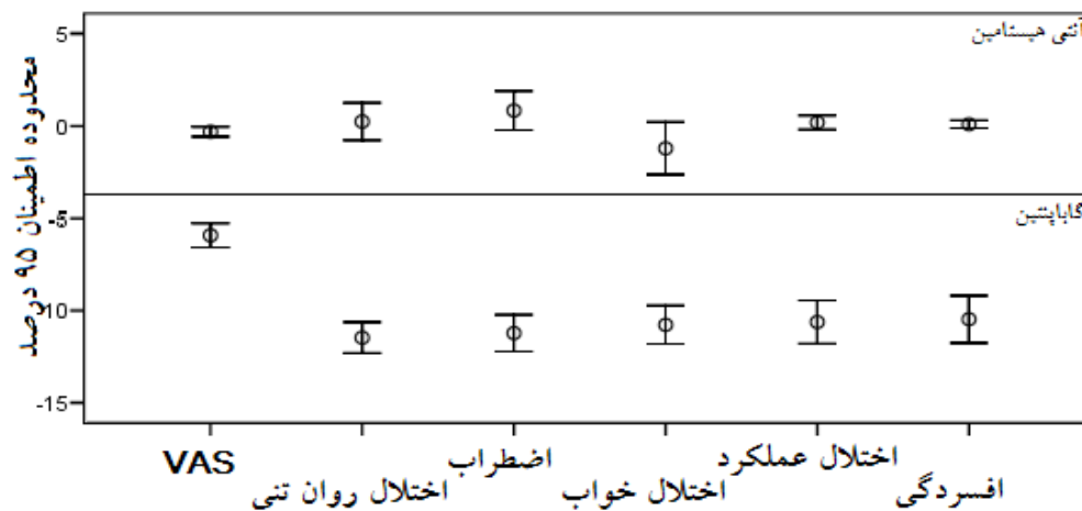
نمودار شماره ۲: متوسط تغییرات پارامترهای بررسی شده پس از درمان در دو گروه

تفاوت میانگین مقادیر بررسی شده در دو گروه در نمودار شماره ۲ نشان داده شده است.