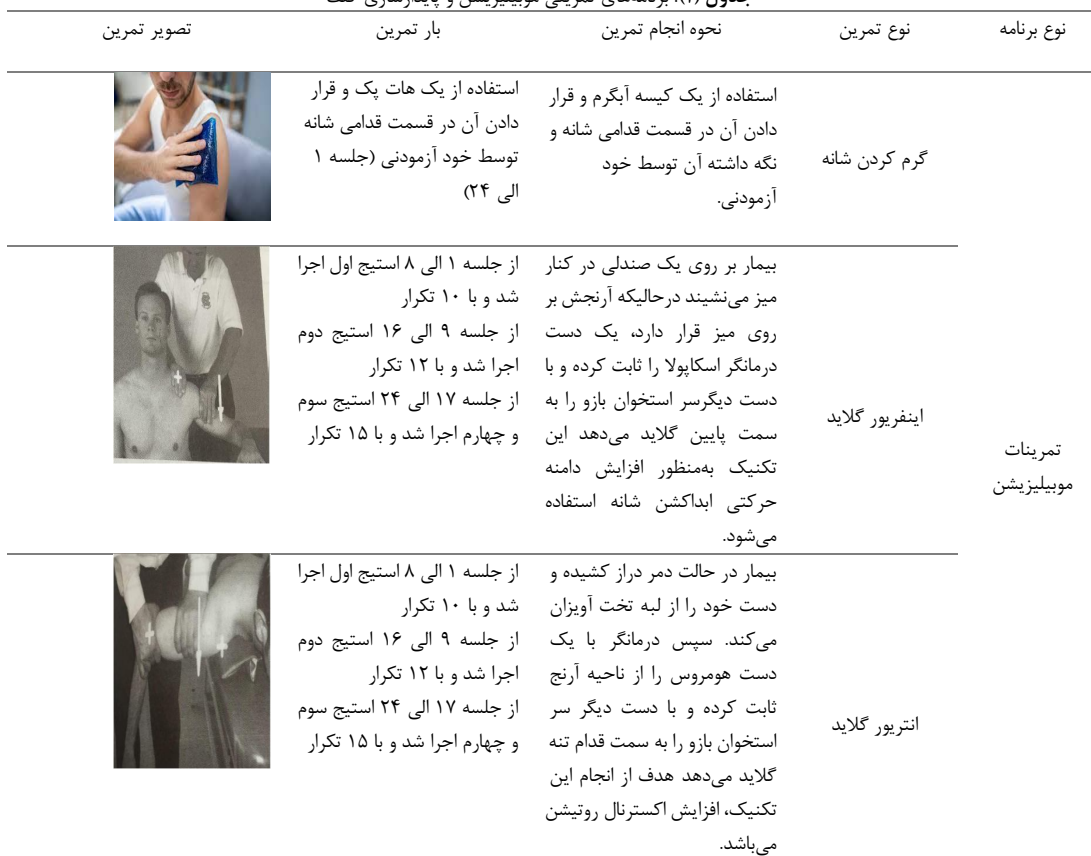
جدول (۱). برنامه‌های تمرینی موبیلیزیشن و پایدارسازی کتف

برنامه موبیلیزیشن (جدول ۱): در ابتدای هر جلسه درمانی، حس انتهای حرکت‌های شانه به‌منظور اجرای تکنیک‌های موبیلیزیشن شانه در محلی که بیمار به سختی دست خود را حرکت می‌دهد و یا انجام حرکت با کمی درد همراه است اندازه‌گیری شد. سپس تکنیک اینفریور گلاید به‌منظور رفع اسپاسم، تکنیک انتریور گلاید به‌منظور