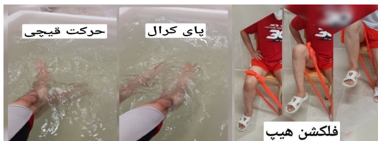
شکل (۱): نمونه‌ایی از تمرینات گروه تراباند و تمرین در آب