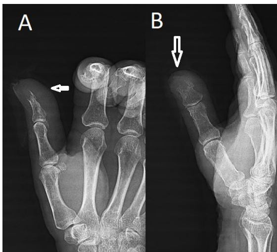
تصویر (۱): رادیوگرافی ساده در دو نمای رخ A و نیم رخ B انگشت شصت دست راست. یک ضایعه لیتیک و با تخریب قشر استخوان دیستال انگشت شصت را به همراه تورم بافت نرم نشان می دهد. (پیکان های سفید، در تصویر A, B)

لیتیک استخوانی را در دیستال فالانکس انگشت نشان می داد (تصویر ۱).