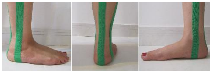
شکل (۱): روش بانداژ مچ پاها به وسیله کینزیوتیپ

برای تجزیه و تحلیل داده‌ها از تست‌های آماری (Repeated Measure) و آنالیز واریانس چند متغیری (Manova) و نرم‌افزارهای SPSS نسخه‌ی ۱۸ استفاده شد. سطح معناداری برای تمامی تحلیل‌های اطلاعاتی ۰/۰۵ قرار داده شد.