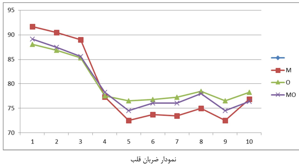
نمودار ضربان قلب