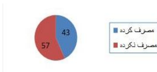
نمودار (۲): درصد میزان سوء مصرف مواد توسط والدین کودک

نمودار فوق، توزیع درصد متغیر نوع کودک‌آزاری را نشان می‌دهد، از مجموع ۲۷۷ مورد کودک‌آزاری بیشترین فراوانی مربوط به غفلت از کودک با تعداد ۶۴ کودک معادل ۲۳.۱ درصد می‌باشد،