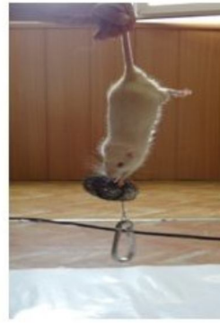
الف) نحوه اندازه گیری قدرت عضلانی