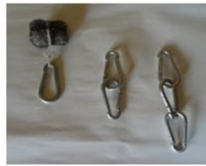
ب) وزنه های مورد استفاده