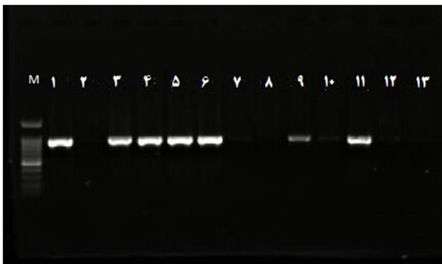
شکل (۱): ژل آگارز حاوی نمونه‌های PCR حاصل از تکثیر ژن‌های گروه CTXM-9. M: مارکر 100bp، 1: کنترل مثبت، 2: کنترل منفی، نمونه‌های 3، 4، 5، 6، 9 و 11: ایزوله‌های مثبت

93 نمونه، 72 نمونه (77/4 درصد) به وسیله PCR، CTX-M مثبت بودند (15). Pak- Leung Ho در هنگ‌کنگ به بررسی مقاومت آنتی‌بیوتیکی وسیع‌الطیف در ایشریشیاکلی و کلبسیلا با بررسی 46 نمونه ایشریشیاکلی و هشت نمونه کلبسیلا پنومونیه توانستند باکتری‌های مولد ESBL را شناسایی کنند، که از بین 46 نمونه، هشت جدایه ایشریشیاکلی و از بین هشت جدایه کلبسیلا پنومونیه، چهار مورد مولد ESBL بودند، که توانستند انواع CTX-M9، CTX-M24، CTX-M14، SHV در این نمونه‌ها همچنین ژن‌های TEM1b و TEM1c و نیز در این نمونه‌ها مشاهده شد (16). در مطالعه دیگری که توسط بن و همکاران که در سال 2009 به صورت مطالعه چندمرکزی انجام شد، مشخص گردید عفونت‌های ناشی از باکتری‌های تولیدکننده ESBL متعلق به خانواده‌ی انتروباکتریاسه رو به افزایش بوده و با مرگ‌ومیر بالاتری همراه هستند. افزایش شیوع CTX-M در سراسر جهان به دلیل عفونت‌های ناشی از آن‌ها نگران کننده است. در مطالعه بن مطالعه اپیدمیولوژیک 6 مرکز غیر بیمارستانی در اروپا، آسیا و آمریکا شمالی تجزیه و تحلیل گردید و ریسک فاکتورها نیز بررسی شدند. در این مطالعه از مجموع 983 بیمار که 90/5 درصد E.coli، 6/9 درصد کلبسیلا پنومونیه و 2/5 درصد پروتئوس میریبیلیس که شایع‌ترین نوع ESBL، CTXM با 65 درصد موارد بود. از مهم‌ترین ریسک فاکتورهای ابتلا، مصرف روزافزون آنتی‌بیوتیک‌ها بدون انجام تست تعیین حساسیت آنتی‌بیوتیکی، مدت طولانی تحت درمان بودن، طولانی شدن زمان بستری در بیمارستان و سن بالای 65 سال بودند. در این مطالعه نتیجه‌گیری شده بود که با توجه به شایع بودن