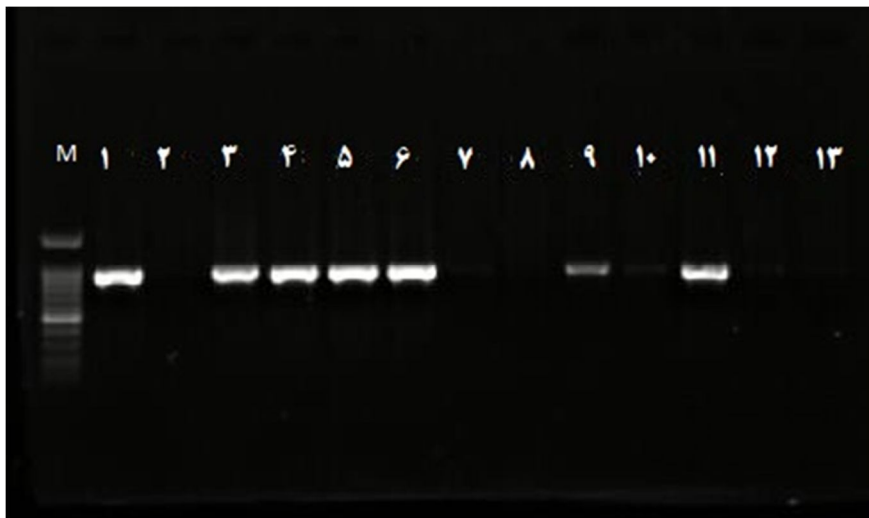
شکل (۱): ژل آگارز حاوی نمونه‌های PCR حاصل از تکثیر ژن‌های گروه CTXM-9. M: مارکر 100bp، 1: کنترل مثبت، 2: کنترل منفی، نمونه‌های 3، 4، 5، 6، 9 و 11: ایزوله‌های مثبت

93 نمونه، 72 نمونه (77/4 درصد) به وسیله PCR، CTX-M مثبت بودند (15). Pak- Leung Ho در هنگ‌کنگ به بررسی مقاومت آنتی‌بیوتیکی وسیع‌الطیف در ایشریشیاکلی و کلبسیلا با بررسی 46 نمونه ایشریشیاکلی و هشت نمونه کلبسیلا پنومونیه توانستند باکتری‌های مولد ESBL را شناسایی کنند، که از بین 46 نمونه، هشت جدایه ایشریشیاکلی و از بین هشت جدایه کلبسیلا پنومونیه، چهار مورد مولد ESBL بودند، که توانستند انواع CTX-M9، CTX-M24، CTX-M14 را شناسایی کنند و همچنین ژن‌های TEM1b و TEM1c و نیز SHV در این نمونه‌ها مشاهده شد (16). در مطالعه دیگری که توسط بن و همکاران که در سال 2009 به صورت مطالعه چندمرکزی انجام شد، مشخص گردید عفونت‌های ناشی از باکتری‌های تولیدکننده ESBL متعلق به خانواده‌ی انتروباکتریاسه رو به افزایش بوده و با مرگ‌ومیر بالاتری همراه هستند. افزایش شیوع CTX-M در سراسر جهان به دلیل عفونت‌های ناشی از آن‌ها نگران کننده است. در مطالعه بن مطالعه اپیدمیولوژیک 6 مرکز غیر بیمارستانی در اروپا، آسیا و آمریکا شمالی تجزیه و تحلیل گردید و ریسک فاکتورها نیز بررسی شدند. در این مطالعه از مجموع 983 بیمار که 90/5 درصد E. coli، 6/9 درصد کلبسیلا پنومونیه و 2/5 درصد پروتئوس میریبیلیس که شایع‌ترین نوع ESBL، CTXM با 65 درصد موارد بود. از مهم‌ترین ریسک فاکتورهای ابتلا، مصرف روزافزون آنتی‌بیوتیک‌ها بدون انجام تست تعیین حساسیت آنتی‌بیوتیکی، مدت طولانی تحت درمان بودن، طولانی شدن زمان بستری در بیمارستان و سن بالای 65 سال بودند. در این مطالعه نتیجه‌گیری شده بود که با توجه به شایع بودن