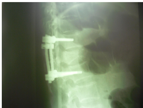
شکل شماره (۲)