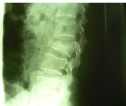
شکل شماره (۱)

در مرحله دوم با اصلاح مسیر و تعیین محل ورود پیچ‌ها، فقط ۱۰ پیچ (۱۵/۵٪) جاگذاری مناسب نداشتند که از این ۱۰ پیچ، ۴ پیچ در مهره L 2 از 6/5 \times 4.0^\circ به 6/5 \times 4.5^\circ و در مهره T 11 ۶ پیچ از 4/5 \times 4.0^\circ به 5/5 \times 4.5^\circ تبدیل و اصلاح مسیر داده شده است (۶ عدد در سمت چپ و ۴ عدد در سمت راست بوده است) در حین عمل جراحی هیچ‌گونه عارضه‌ای از قبیل پارگی دورمر، لیک CSF و خون‌ریزی وسیع وجود نداشته در فالوآپ ۶ ماه تا ۳ سال بیماران از پیچ‌های گذاشته شده ۳ مورد وضع نسبتاً مناسب نداشتند (۱/۶٪) و فقط یک مورد عفونت سطحی در محل انسزیون وجود داشته و عارضه دیگری وجود نداشته است.