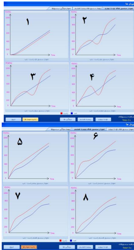
شکل ۳: نمایش نمونه‌ای از نمودارهای تغییرات توزیع فشار (KPa) - زمان (s) مربوط به حسگرها در خروجی نرم افزار

در نهایت، میانگین فشار پای راست در دو گروه بیماران ACL پای راست و گروه کنترل نیز مقایسه گردید. در حالات ایستایی و حرکتی اختلاف معناداری مشاهده شد ( P < 0.05 ). توزیع فشار در پای راست گروه بیماران ACL پای راست خیلی کمتر از توزیع فشار در پای راست گروه کنترل بود (جدول ۵).