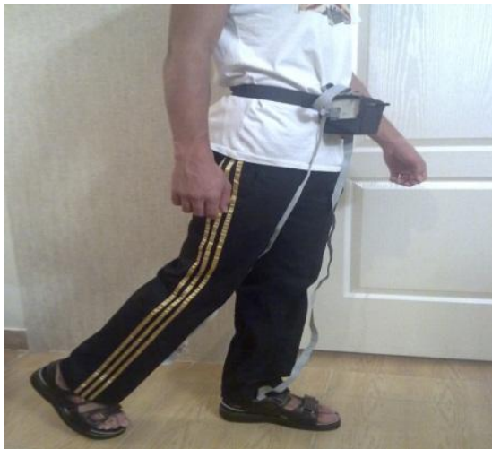
شکل الف: نمایش نحوه پوشیدن و اتصال ابزار اندازه گیری

یک پردازشگر و سپس از طریق ماژول RF (Radio Frequency) به صورت بی‌سیم به کامپیوتر یا لپ‌تاپ منتقل گردید. اطلاعات دریافتی به نرم‌افزار طراحی شده با CSharp منتقل، پس از پردازش در نرم‌افزار، رنگ‌بندی نواحی فشار مشخص شده در کفی، متناسب با میزان فشار اعمالی، تغییر کرد (شکل ب). رنگ‌بندی نقاط فشاری شامل رنگ طوسی نشانگر فشار ۸۰۰-۱۰۰۰ کیلو پاسکال، رنگ آبی نشانگر فشار ۶۰۰-۸۰۰ کیلو پاسکال، رنگ سبز نشانگر فشار ۴۰۰-۶۰۰ کیلو پاسکال، رنگ نارنجی نشانگر فشار ۲۰۰-۴۰۰ کیلو پاسکال و رنگ قرمز نشانگر فشار ۰-۲۰۰ کیلو پاسکال می‌باشد. در خروجی نمودارهای مربوط به تغییرات رنگی هر یک از حسگرهای پای راست و چپ بعد از ۵ ثانیه نمایش داده شدند (شکل ج). سپس تحلیل آماری بر روی داده‌ها با استفاده از نرم افزار SPSS Ver.13 از طریق آزمون Paired Samples T-Test انجام شد.