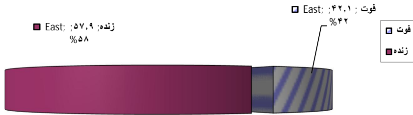
نمودار شماره (۳): توزیع فراوانی نسبی میزان مرگ و میر در جمعیت مورد مطالعه