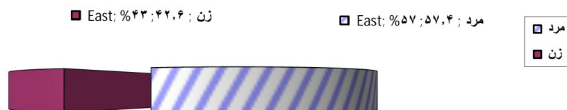
نمودار شماره (۲): توزیع فراوانی نسبی جمعیت مورد مطالعه برحسب جنس