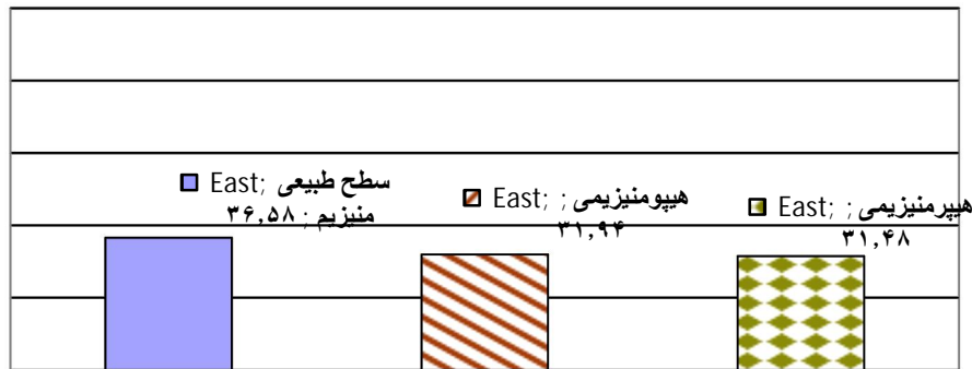
نمودار شماره (۴): توزیع فراوانی نسبی سطح منیزیم در جمعیت مورد مطالعه