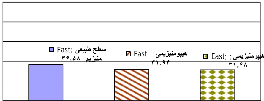
نمودار شماره (۴): توزیع فراوانی نسبی سطح منیزیم در جمعیت مورد مطالعه